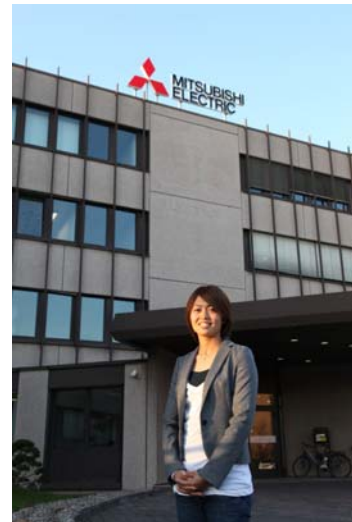
Kozue Ando bei Mitsubishi Electric

Am 9. November 2011 war Kozue Ando zu Gast in der deutschen Niederlassung von Mitsubishi Electric in Ratingen. „Nach dem Weltmeistertitel ist es mein nächstes Ziel, die deutsche Meisterschaft und die Goldmedaille bei den Olympischen Spielen 2012 in London zu gewinnen“, sagte die Weltmeisterin, die seit ihrem 3. Lebensjahr Fußball spielt. „Nachdem die japanische Nationalmannschaft den WM Titel gewonnen hat, ist Fußball in Japan sehr viel populärer geworden. Der deutsche Fußball hat bei